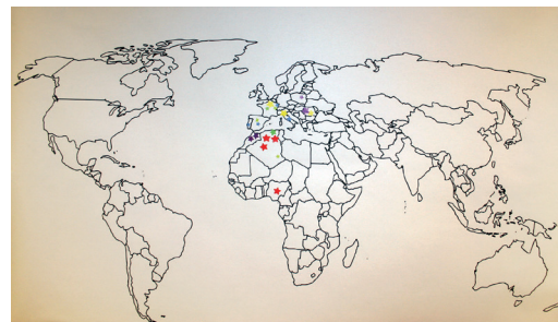
Carte réalisée lors de l'animation avec la MEJE, voir article page 4

On retrouve souvent le terme de sécularisation qui peut se confondre avec la laïcisation. En effet ces deux termes se ressemblent dans leur définition mais pourtant cela ne signifie pas la même chose. La sécularisation désigne un processus de perte d'influence de la religion dans une société, tandis que la laïcisation est évoquée lorsqu'on parle de séparation entre les institutions politiques et la religion. L'une concerne la société et l'autre les institutions.