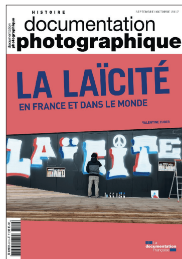
Zuber V. (dir.), « La laïcité en France et dans le monde », la Documentation photographique, n°8119, sept-oct 2017, La Documentation Française, 64 P.